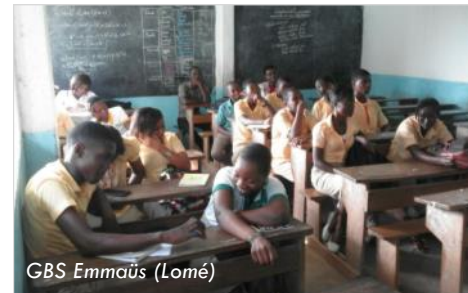
GBS Emmaüs (Lomé)