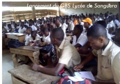
Lancement du GBS Lycée de Sanguèra

A Kara, la deuxième ville universitaire, 4 groupes d'étudiants se sont formés systématiquement après le séminaire d'octobre dans le but d'aller vers 4 villes différentes pour la restitution.