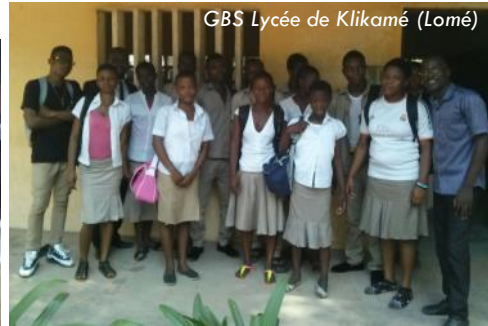
GBS Lycée de Klikamé (Lomé)