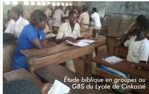
Étude biblique en groupes au GBS du Lycée de Cinkassé